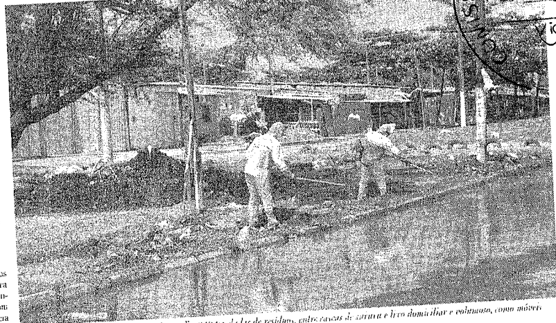
Matéria de limpeza no Depo Positivo, com 210 toneladas de resíduos, entre cascas de serra e lixo doméstico, com móveis