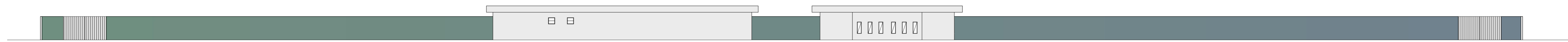
FACHADA FRONTAL Esc. 1/50